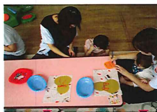
敬老の日プレゼント制作