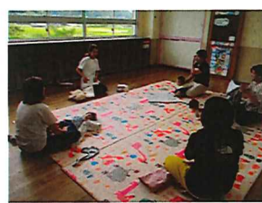
ベビーマッサージ教室